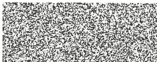
poskytovatel obce Stonava Tomáš Wawrzyk

Obec Stonava bude zpracovávat osobní údaje pouze pro dobu, která je nezbytně nutná k dosažení účelu jejich zpracování. Touto dobou se rozumí: doba nezbytná k vyřízení žádosti a její vypořádání. Vaše osobní údaje jsou vedeny a zabezpečeny v souladu se zákonem č. 110/2019 Sb., o zpracování osobních údajů a v souladu s Nařízením Evropského parlamentu a Rady (EU) č. 2016/679 ze dne 27.04.2016, obecného nařízení o ochraně osobních údajů.