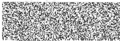
poskytovatel obce Stonava Tomáš Wawrzyk

Obec Stonava bude zpracovávat osobní údaje pouze pro dobu, která je nezbytně nutná k dosažení účelu jejich zpracování. Touto dobou se rozumí: doba nezbytná k vyřízení žádosti a její vypořádání. Vaše osobní údaje jsou vedeny a zabezpečeny v souladu se zákonem č. 110/2019 Sb., o zpracování osobních údajů a v souladu s Nařízením Evropského parlamentu a Rady (EU) č. 2016/679 ze dne 27.04.2016, obecného nařízení o ochraně osobních údajů.