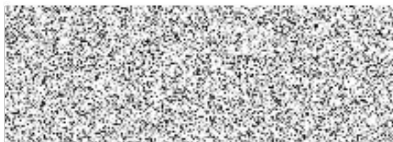
Tomáš Wawrzyk starosta obce Stonava